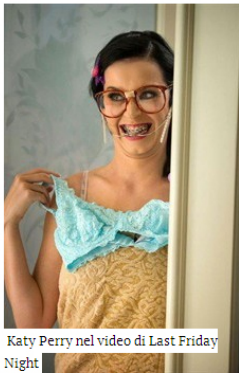
Katy Perry nel video di Last Friday Night

D i origine italiana, quasi per caso inizia la sua scalata al successo in America conquistando il gusto delle donne miamite. Sono passati 30 anni dai giorni di quell'esordio e quest'anno, il brand di lingerie made in Italy Cosabella , oltre a festeggiare questo importante anniversario, si è aggiudicato anche il Femmy Award , un vero e proprio "Oscar" della lingerie.